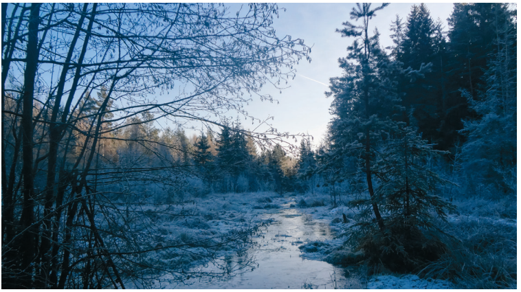
Häuseloh bei Selb

wir eine naturreine, ehrliche und dauerhafte Seife (Handseife oder Haarseife) bzw. Zahnpulver mit Gartenkräutern her. Die Haarseife wird wie eine Handseife traditionell gesiedet, Zahnpasta trocken als Zahnpulver hergestellt.