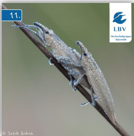
Geschwänzter Stengelrüssler aus dem ART-ventskalender

Die LBV Hochschulgruppe hat für das Wintersemester ihr mittlerweile siebtes Programmheft veröffentlicht. Neben Exkursionen in die Umgebung wird es auch wieder spannende Fachvorträge von den Artenkennern geben. Das Programm wurde an der Semestereröffnungsfeier am Lindenhof zusammen mit dem Film „Der Schwalbach – Leben zwischen den Elementen“ präsentiert. Die kalte Zeit überbrücken die Studenten mit einem selbstgemachten ART-ventskalender. Jeden Tag wird den Mitgliedern eine Art vorgestellt. Die Bilder werden auch auf dem Instagram-account @eineminutenatur veröffentlicht. Dabei sind die Arten so vielfältig wie die Interessen und Projekte der Mitglieder. Vögel, Insekten, Pflanzen oder Flechten – Das Motto lautet wie immer „Vielfalt statt Einfach“.